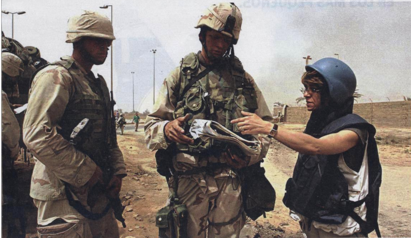
LA CORRESPONSAL DE GUERRA, ATAVIADA CON UN CHALECO ANTIBALAS, HABLA CON DOS MILITARES ESTADOUNIDENSES EN BAGDAD.